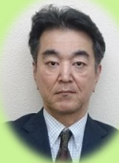
有限会社マイスター・ラボラトリー